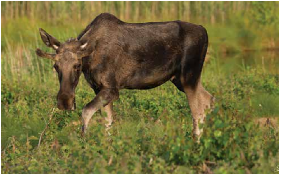
Elg i Lille Vildmose.

Det ændrer sig pinsedag. Da de rammes af Guds kraft, Helligånden, da genfinder de deres tro og livsmod. De begynder at prædike: fortælle om Jesus Kristus, Guds Søn og vores frelser. Vi har Peters første prædiken gengivet i Apostlenes Gerninger, men alle disciplene har fortalt, hvad de hver især har fået med fra deres liv i Jesu nærhed.