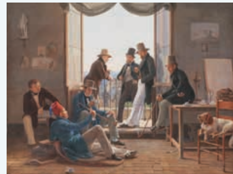
Constantin Hansen. Et selskab af danske kunstnere i Rom, 1837. Tilhører Statens Museum for Kunst, København (public domain)