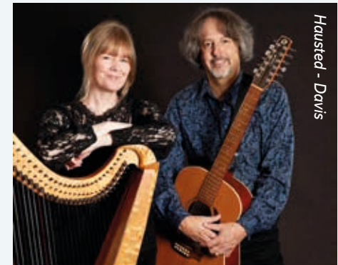
Hausted - Davis